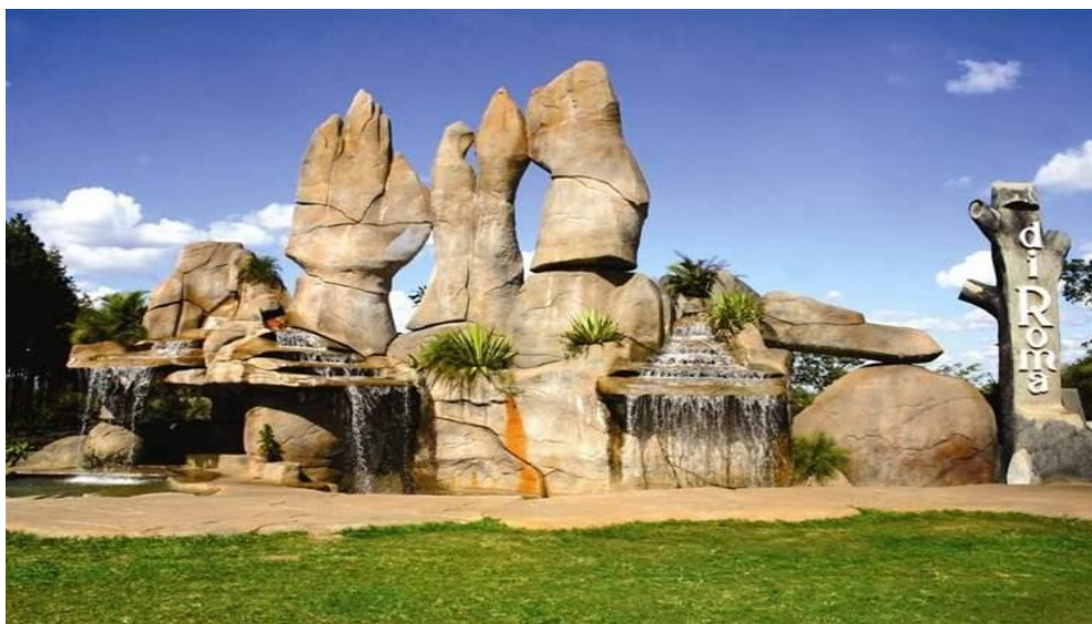
Di Roma – Entrada da Cidade