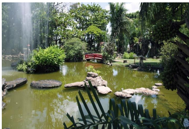
Jardim do Japonês