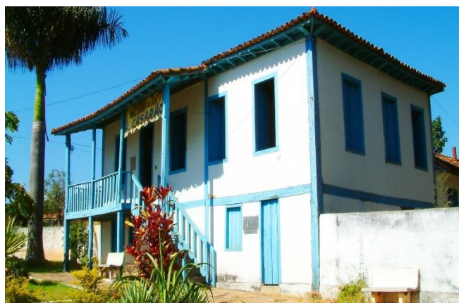
Casarão dos Gonzaga