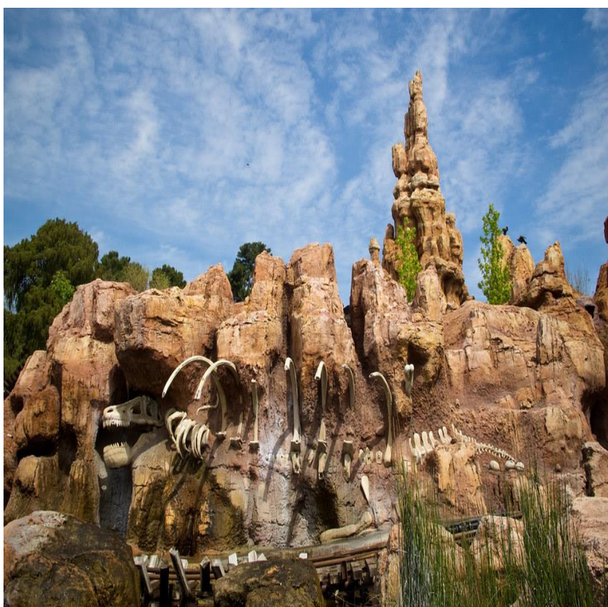
Clube Di Roma

Caldas Novas, cidade acolhedora e hospitaleira que recebe você de braços abertos. Sintam-se em casa!