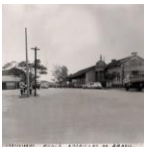
Estação Ferroviária Praça Americano do Brasil