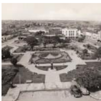
Praça Bom Jesus

Nascido em 1º de setembro de 1856, Zeca Batista está intimamente relacionado à história de Anápolis, para onde veio trabalhar como professor em 1882. Com a falta de médicos e farmacêuticos ele também exerceu tais atividades, além de atuar no comércio. Em 1907, construiu a casa que hoje abriga o Museu Histórico de Anápolis. Vários acontecimentos se deram nesse período em nível nacional como a abolição da escravatura e a proclamação da república e, em nosso município, o falecimento de Gomes de Sousa Ramos (1889). Zeca desfrutou em Anápolis e Goiás de grande prestígio. Faleceu em 7 de dezembro de 1910.