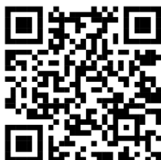
Centro de Convenções de Anápolis