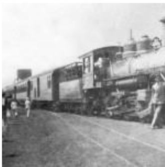
Primeiro trem de Anápolis