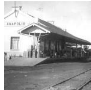
Estação Ferroviária em 1930